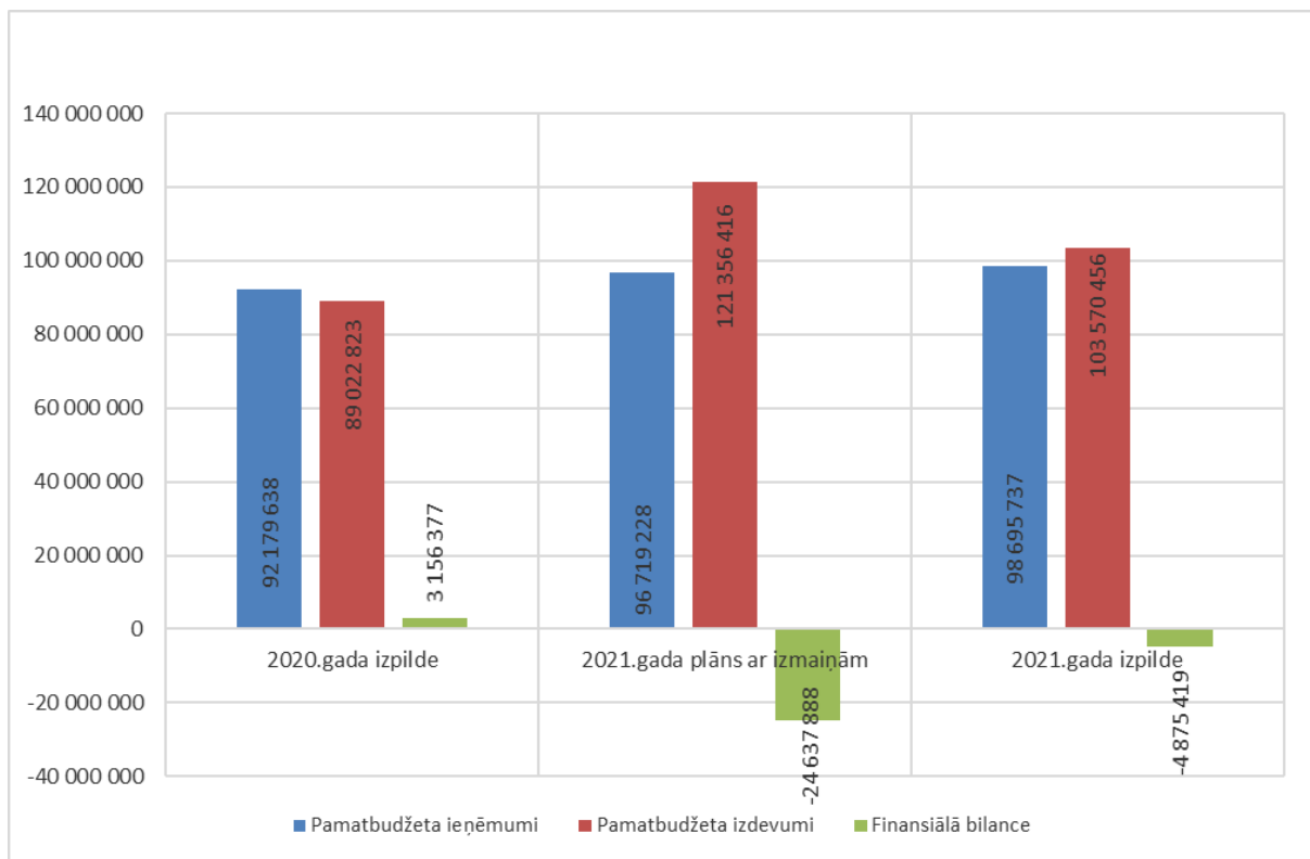
1.attēls.Jūrmalas pilsētas pašvaldības pamatbudžeta ieņēmumi, izdevumi un finansiālā bilance 2020.gadā un 2021.gadā (EUR)

Jūrmalas valstspilsētas pašvaldības konsolidētā budžeta izpilde 2021.gadā ieņēmumos bija 98 696 237 EUR, kas ir par 6 515 899 EUR jeb 7% vairāk kā 2020.gadā, konsolidētā pamatbudžeta izdevumu izpilde ir 103 571 656 EUR, kas ir par 14 547 695 EUR jeb 16.3% vairāk kā 2020.gadā. Detalizēta informācija skatāma 1.tabulā.